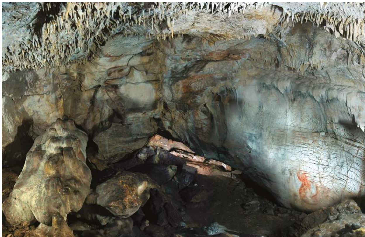
1a. Grotte Paglicci (Rignano Garganico, Foggia, Italie). Vue de la salle des peintures (salle 3), photo S. Ricci.